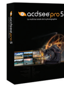
ACDSee Pro 5